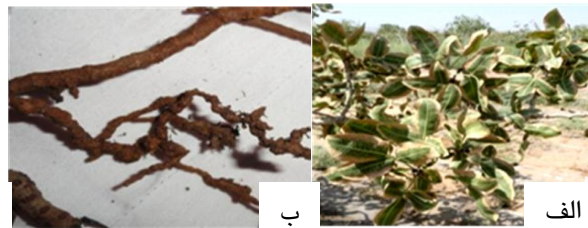
شکل ۱- الف: علائم نماتد مولد گره ریشه روی درختان آلوده پسته ب: ریشه‌های آلوده به نماتد. ج:

از راهکارهای کنترل مؤثر باشد. چنین اطلاعاتی برای برنامه‌ریزی سامانه‌های کشت و به حداقل رساندن خسارت نماتد مفید خواهد بود. تحقیق حاضر در جهت نیل به این اهداف انجام گرفته است.