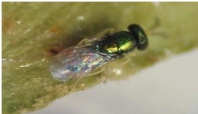
شکل ۷- زنبور پسیلافاگوس Psyllaphagus pistaciae