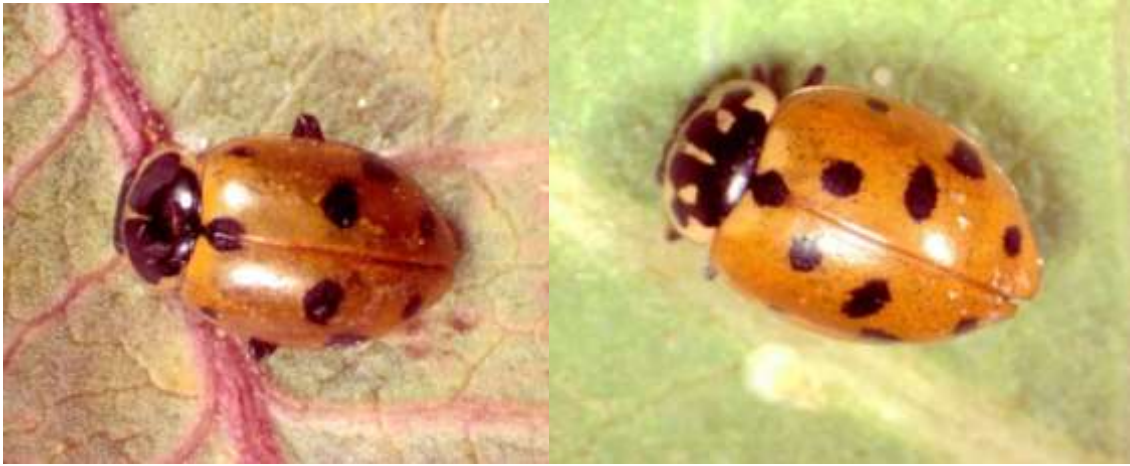
شکل ۲- دو فرم کفشدوزک Hippodamia variegata