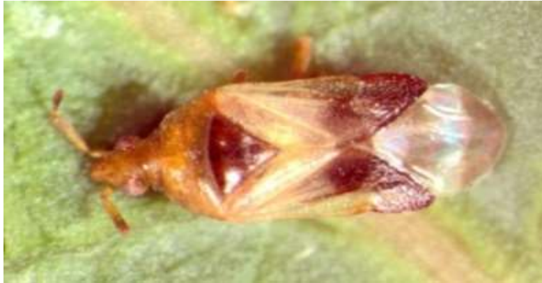
شکل ۶- سن شکاری Anthochoris minki pistaciae