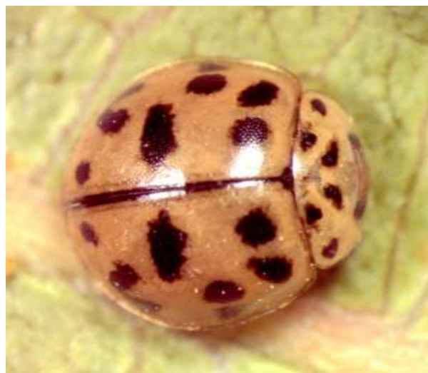
شکل ۱- کفشدوزک Oenopia conglobata contaminata

نمودار ۱- درصد فراوانی گونه‌های کفشدوزک در باغ‌های پسته منطقه دامغان ( Chilocorus bipustulatus* پسپیل خوار نیست)