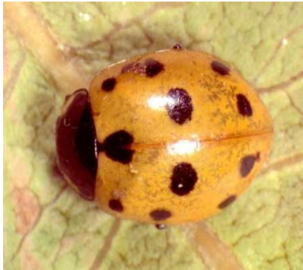
شکل ۳- کفشدوزک یازده نقطه‌ای Coccinella undecimpunctata aegyptica