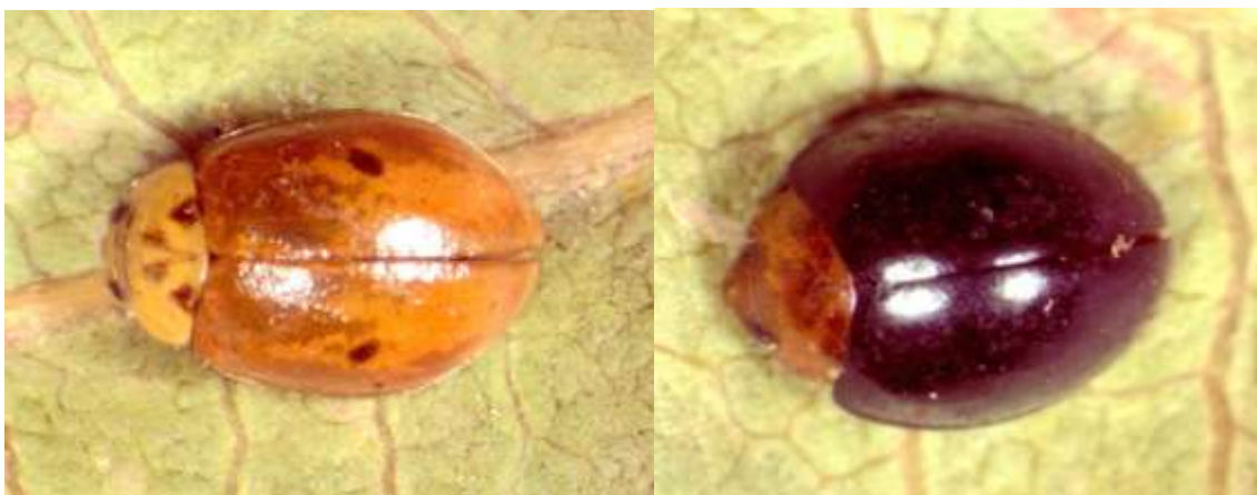
شکل ۴- کفشدوزک دو نقطه‌ای Adalia bipunctata (راست)، کفشدوزک Exochomus nigripennis (چپ)